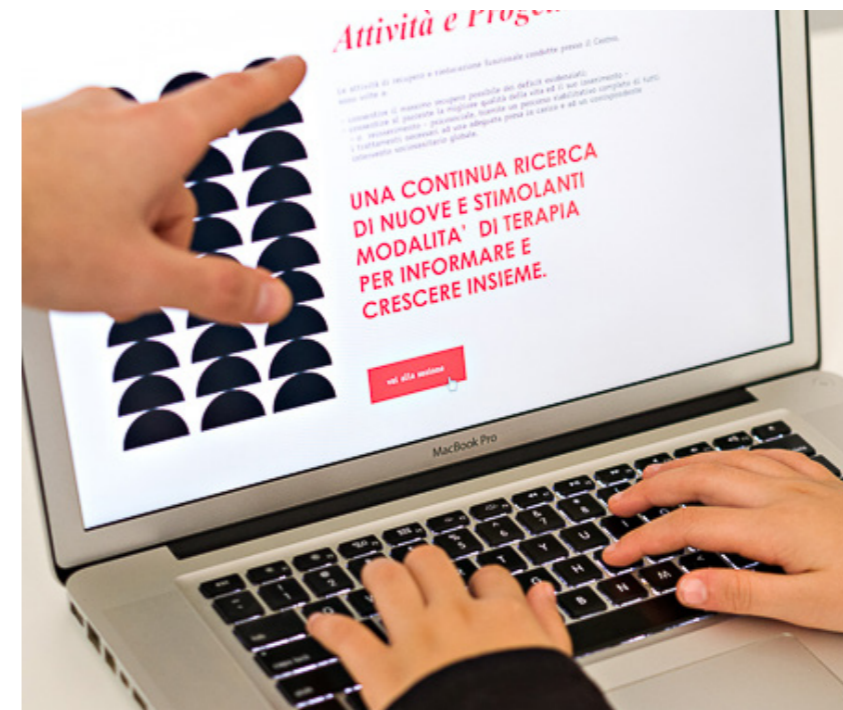
Laboratori informatici e punti demo Anastasis