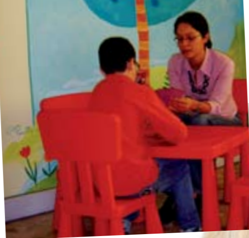
IMMAGINI DEL CENTRO